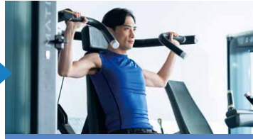
各種設備・プログラムを利用

ロッカールームでウェアに着替えま。荷物は必ずロッカーの中に入れてください。貴重品は専用ロッカーのご利用をおすすめします。