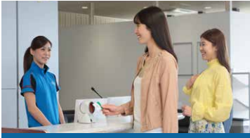
フロントでチェックイン

入口もしくはチェックインカウンター周辺に設置されている端末に会員カード・二次元コードのどちらかをかざします。