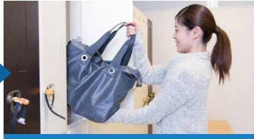
ロッカールームで着替え

入口もしくはチェックインカウンター周辺に設置されている端末に会員カード・二次元コードのどちらかをかざします。