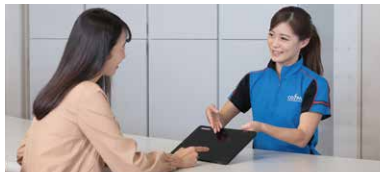
タブレット入力 or 店頭端末入力